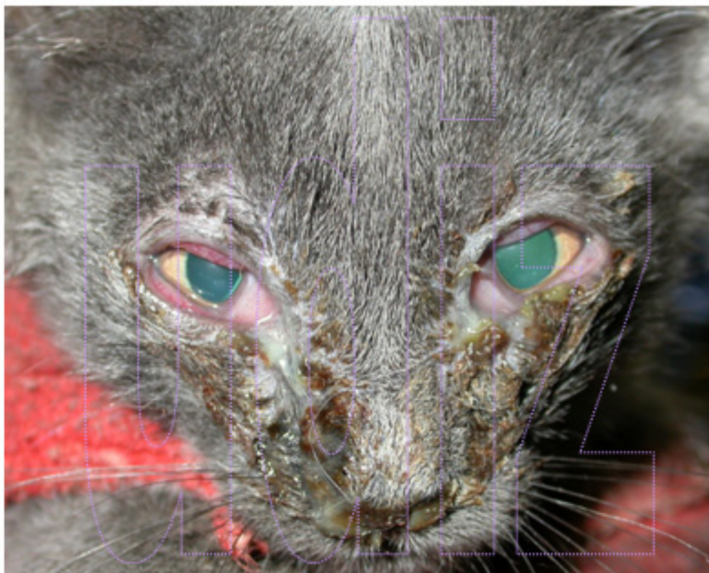
Aspecto al entrar a consulta

Los herpesvirus (rinotraqueítis) tienen una sintomatología muy llamativa, pero generalmente son procesos benignos (si no se complican con otras enfermedades) que curan con el tratamiento adecuado, hay animales que quedan portadores y pueden tener recaídas posteriormente pero suelen ser menos llamativas (estornudos, toses, conjuntivitis crónicas, lagrimeo...) que en animales jóvenes.