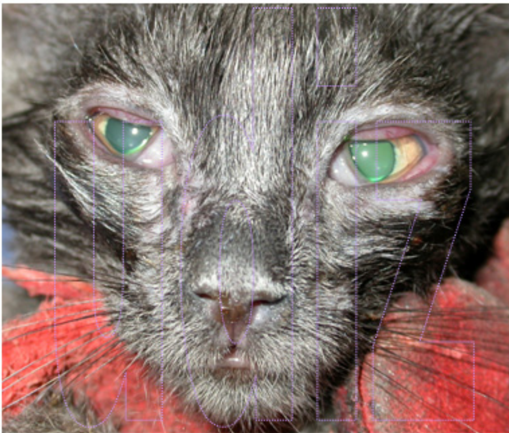
Aspecto tras la cura en la 1ª consulta